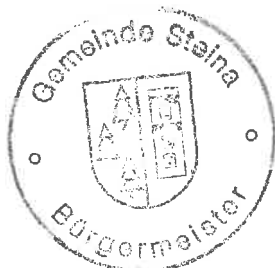
Sandro Bürger Bürgermeister

Beschluss-Nr. ST-B/2021/106 vom 21.09.2021