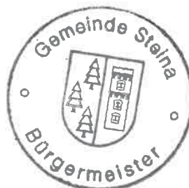
Sandro Bürger Bürgermeister

Beschluss-Nr. ST-B/2022/168 vom 18.10.2022