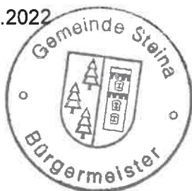
Sandro Bürger Bürgermeister

Beschluss-Nr. ST-B/2022/166 vom 18.10.2022