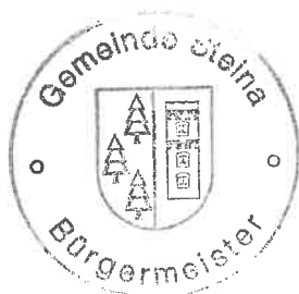
Sandro Bürger Bürgermeister

Beschluss-Nr. ST-B/2022/177 vom 20.12.2022