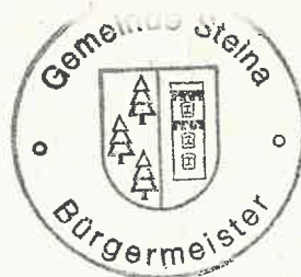
Sandro Bürger Bürgermeister